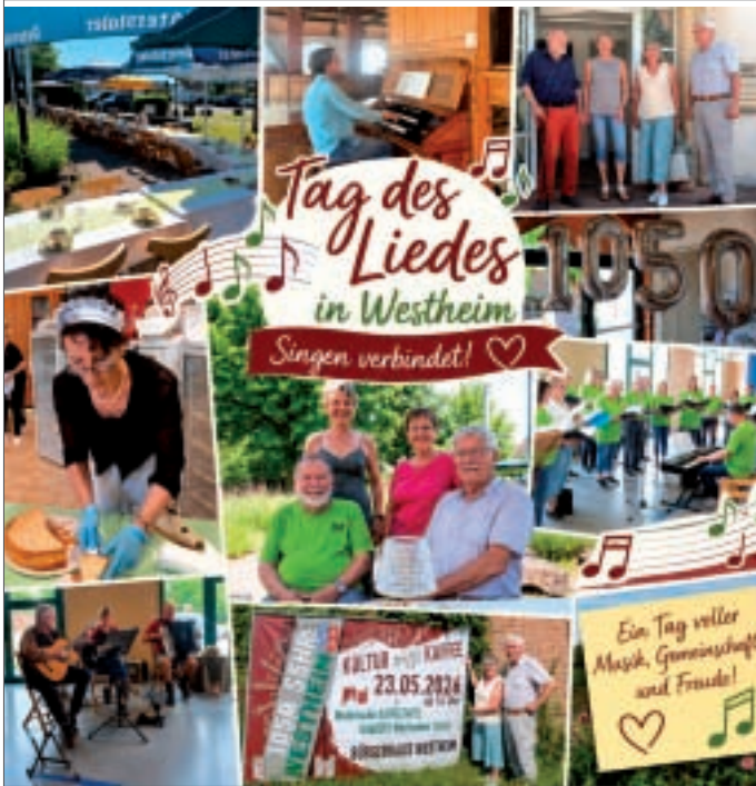
● Bilderbuch der bunten Tage in Westheim. Collage/Fotos: Katrin Gillert