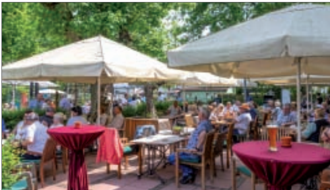
● Mit Blasmusik lockte der Landgasthof zum Mühlenteich zu Pfingsten wieder zahlreiche Besucher in den Biergarten in Eggersdorf.