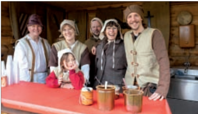
● Vereinsmitglieder haben wieder herzlich die Gäste an ihren zahlreichen Ständen betreut.