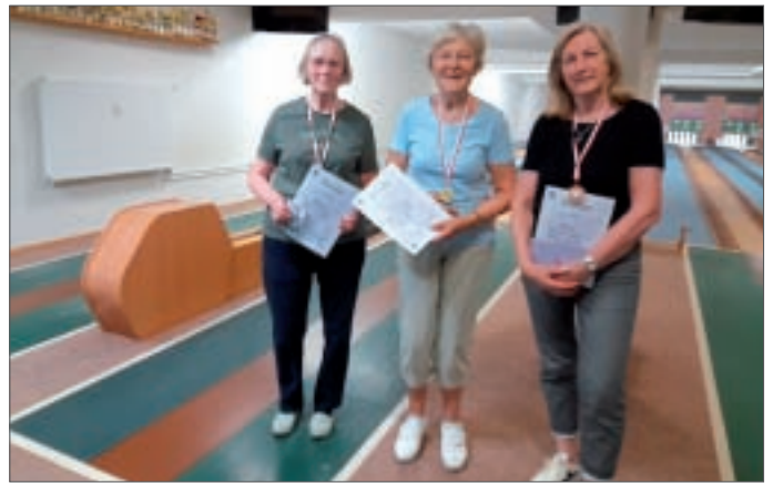
• Die Gewinner der Damen.