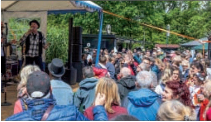
● Traditionell rockte Belmondo am Bötzsee – im Restaurant Casa Romana.