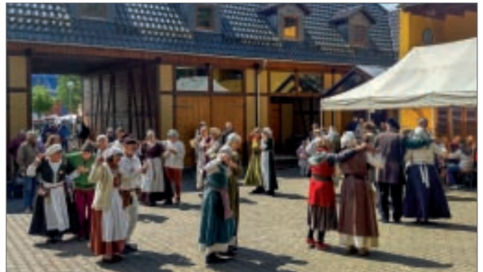
● Die Folkdance-Gruppe lud alle Gäste ein, mitzutanzten.