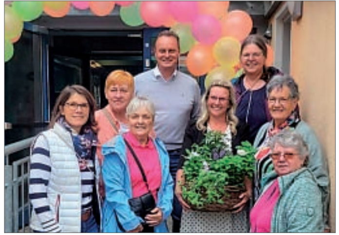
• Zum Jubiläum „20 Jahre Kneipp-Kita“: Kinderhilfe-Akteure haben einen Korb mit Duftkräutertöpfchen und Tütchen zum weiteren Basteln dabei. Vom Bürgermeister (Bildmitte) gab's ein Wassertretbecken als Jubiläumsgeschenk.

Der Vorstand des Förderverein Grundschule Am Dorfanger e.V. | Instagram: @fvgs.amdorfanger