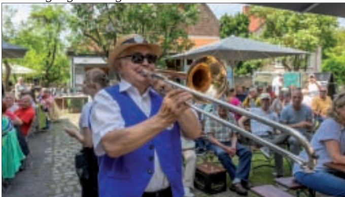
● Gut gefüllt war der Biergarten im Madels beim traditionellen Pfingstkonzert der Dorfmusikanten. Die Spenden flossen wieder an den Verein Dorfsaal e.V., der das Konzert organisiert hatte.