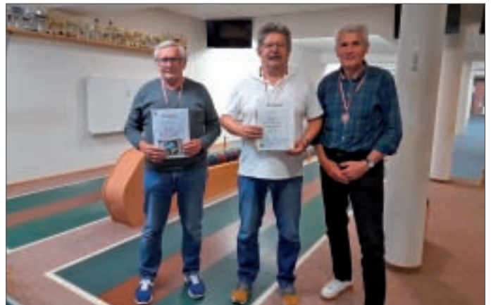
• Die Gewinner der Herren.