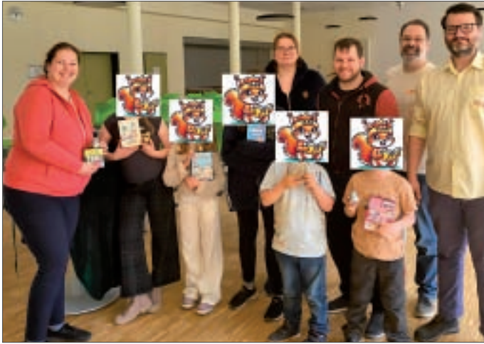
• Die Preisträger-Kinder, das Orga-Team und helfende Hände.