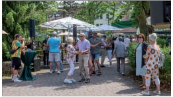
● Dabei wurde auch ordentlich das Tanzbein geschwungen...