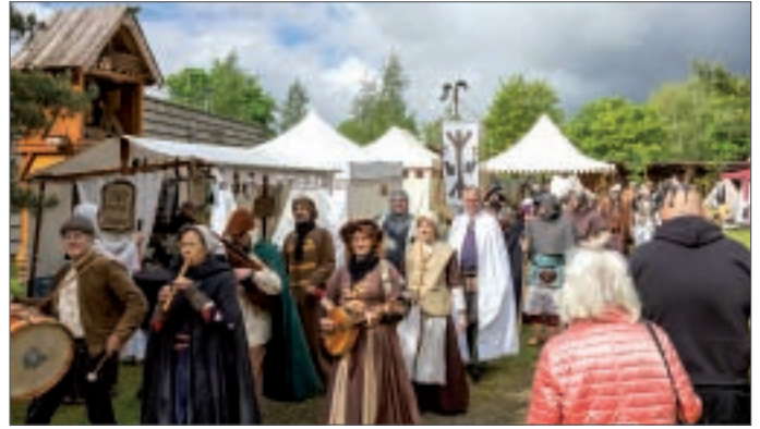
● während beim Bauernvolk das mittlerweile 26. Historische Dorffest zelebriert wurde, beginnend mit dem Umzug übers Gelände Am Fuchsbau