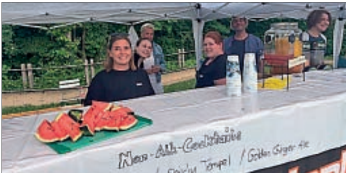
● Gut aufgelegt – die Mädels von der „Non-Alk-Cocktailbar“.