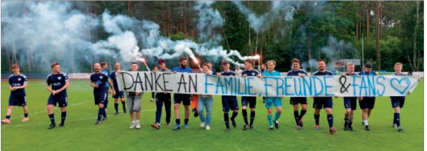
• Blau-Weiß ‚Zwei‘ sagt DANKE für die Unterstützung im Fußball-Spieljahr 2025/26.