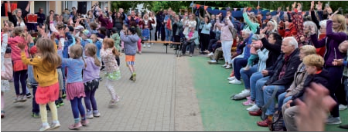
● Mit einem kleinen Programm begrüßen die Kneipp-Kinder die Gäste.