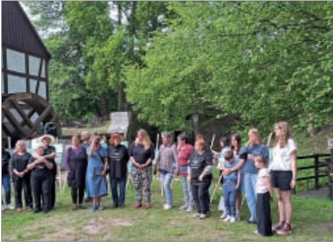
• Nach dem Workshop am Mühlenmuseum.