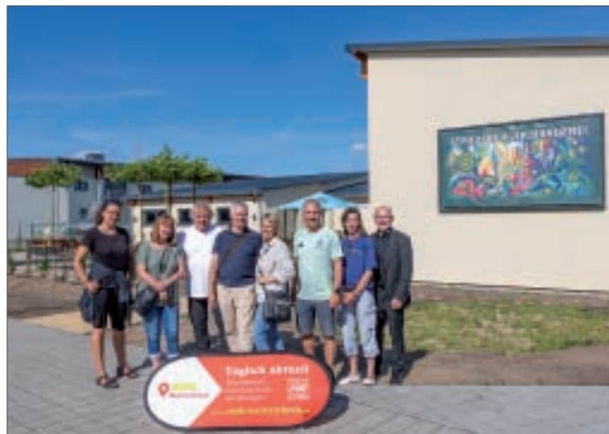
• Ein Teil des Teams von MOL-Nachrichten.