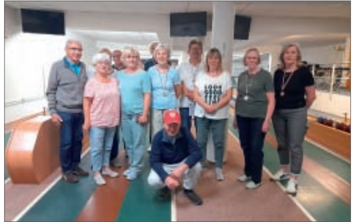
• Die Teilnehmer des diesjährigen Kegeltturniers in der Seniorenwoche.