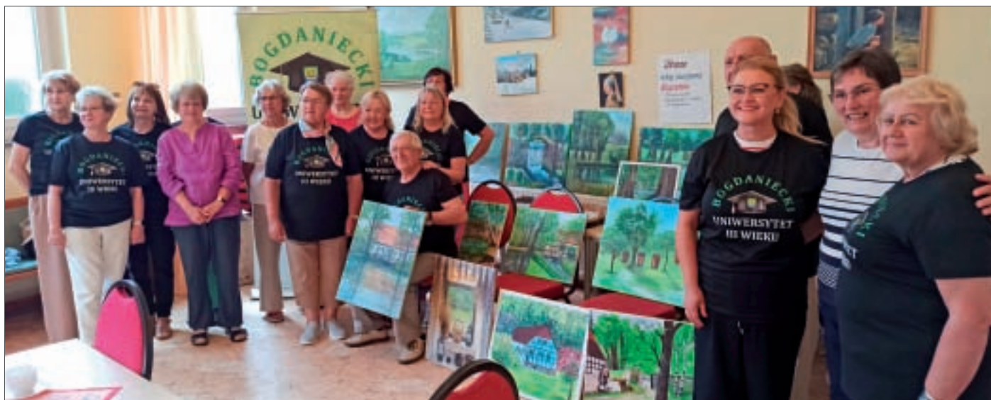
● Gruppenbild beim Gegenbesuch der Mitglieder der Seniorenuni in Petershagen.

Am 8. Juni war hier bei uns die Wiedersehensfreude groß. Alle brachten ein großes, wagenradrundes Brot und andere Köstlichkeiten für den gemeinsamen Tag mit. Zur Begrüßung überraschte ein Zitherkonzert die Gäste – Musik verbindet schließlich. Nach einem genussvollen Mittagessen im Saal griff die Gruppe wieder zu den Farben, doch die Staffeleien blieben unberührt. Statt auf Leinwänden malten sie diesmal Miniaturen auf Baumblätter und Steine. Der Kreativität waren erneut keine Grenzen gesetzt – ganz im Geist der genannten Attribute. Nach der kreativen Arbeit genossen alle einen geselligen Nachmittag beim Grillen mit polnischen Würstchen und deutschem Kartoffelsalat – unterhaltsam, fröhlich und erfüllt von der Freude über die Partnerschaft. Der Tag ging zu Ende, der Abschied rückte näher. Freundinnen und Freunde, Künstlerinnen und Künstler, die diese Verbindung leben und einander unterstützen, verabschiedeten sich – hier und in Bogdaniec.