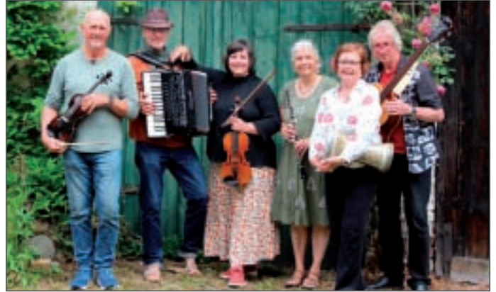
• Die Band „Querbeet“.