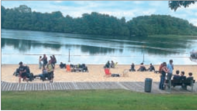
● Chillen am See – auch das genoss die Jugend beim Rave am 05. Juni am Bötzsee.