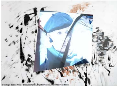
© Collage: Sabina Front | Bildauszüge: Brigitte Dencke, Dörthe Irene Müller

der Monat Mai hält für uns alle wieder viel Aktivität bereit – auch im Brecht-Weigel-Haus schließen wir uns den stadtgesellschaftlichen Veranstaltungen an. Zum Gartentag laden auch wir zu einer besonderen Aktion ein: wir gehen in Arbeitszimmerführungen durch das benachbarte Gärtnerhaus und wer im Anschluss noch mit Blick auf den Pavillon und See verweilen will, kann das Kaffeegedeck gleich mit buchen und genießen. Außerdem hat die Kneipp©-Grundschule „Bertolt Brecht“ Mitte Mai Projektwoche und auch bei uns wird eine Gruppe Schülerinnen und Schüler 3 Tage thematisch verbringen. Die Ergebnisse werden wir dann gern publik machen. Die Künstlerinnen und Künstler der Gruppe Kö12 sind zum 19. Pleinair bei uns zu Gast und wir zeigen deren Arbeiten zum 100. Geburtstag Käthe Reichels ab dem 17.5. im Forum, wenn wir bei kostenfreien Eintritt den Internationalen Museumstag feiern. Zudem habe wir am Donnerstag, den 21. Offene Bibliothek im 1. OG der Villa. Auch wenn Brecht meinte, dass zu Pfingsten „die Geschenke am geringsten“ seien, werden wir am Feiertagswochenende unsere Gäste mit einem Brechtspaziergang durch Haus und Garten beglücken.