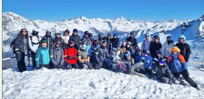
Skifahrt 2026 des Schulcampus Altlandsberg

Stimmung während der ganzen Fahrt richtig gut. Es war eine mega Zeit, die wir alle so schnell nicht vergessen werden!“