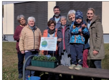
Start der VERGISS?MEIN!NICHT-Pflanzaktion am Bürgerhaus Wesendahl

Am Sonntag, den 29.03.2026 begannen Wesendahler Bürgerinnen und Bürger sowie die Betreiber der Pferdeschenke unter dem Motto „Menschen mit Demenz nicht vergessen“ Vergissmeinnicht zu pflanzen. Diese Blume blüht nun an der Pferdeschenke, am Bürgerhaus Wesendahl und am Bio-Apfelhof Müller. Ein Poster informiert jeweils über die Aktion und Ansprechpartner. Gemeinsam setzen der Ortsbeirat, die Senioren, der KulturGUT- und Sport e. V. Wesendahl, Pferdeschenke und Bio-Apfelhof damit ein sichtbares Zeichen der Verbundenheit und Wertschätzung für Menschen, die direkt oder indirekt von dieser Krankheit betroffen sind. Neben den Kranken selbst sind das auch ihre Familien, Freunde und Bekannte sowie die Pflegenden und zahlreiche ehrenamtliche Helfer. Menschen