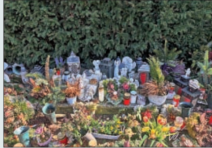
Ablagefläche auf dem Friedhof Altlandsberg

Ihre Friedhofsverwaltung Stadt Altlandsberg