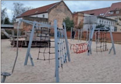
Neue Spielgeräte auf dem Grundschulhof

(jk) Auf dem Schulhof der Grundschule freuen sich die Kinder nun über attraktive neue Spielmöglichkeiten. Angeschafft wurden drei große Spielgeräte, die den bestehenden Bereich rund um das Spielschiff ergänzen. Zusätzlich lädt eine Korkumrandung zum Sitzen, Verweilen und Beobachten ein.