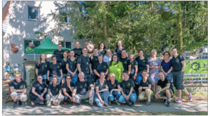
● Fünf Jahre aktiv für den Schutz der Igel: Der Verein Stachelkugel e.V.