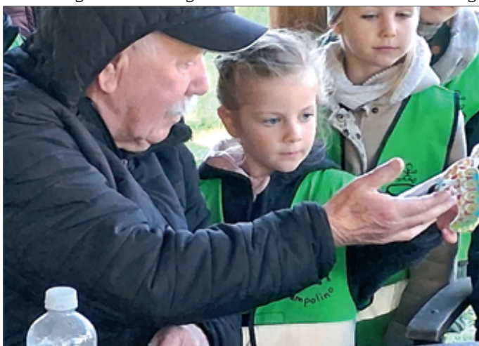
● Alt und jung entdecken gemeinsam die Natur: Hier wird ein selbstgebastelter Vogel bestaunt.