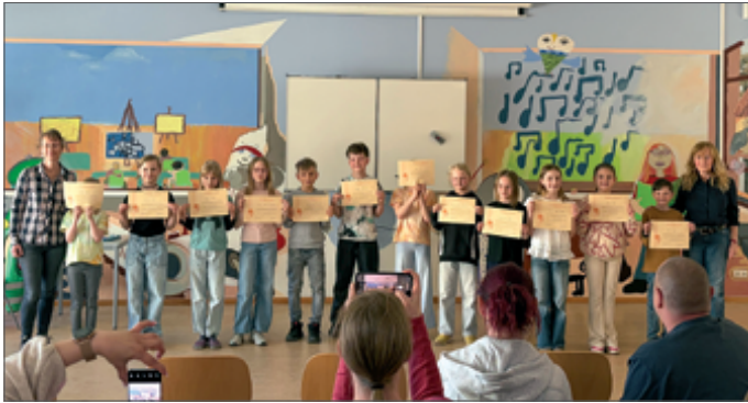
● Ausbildung erfolgreich absolviert: Die neuen Streitschlichter der Grundschule Am Dorfanger.