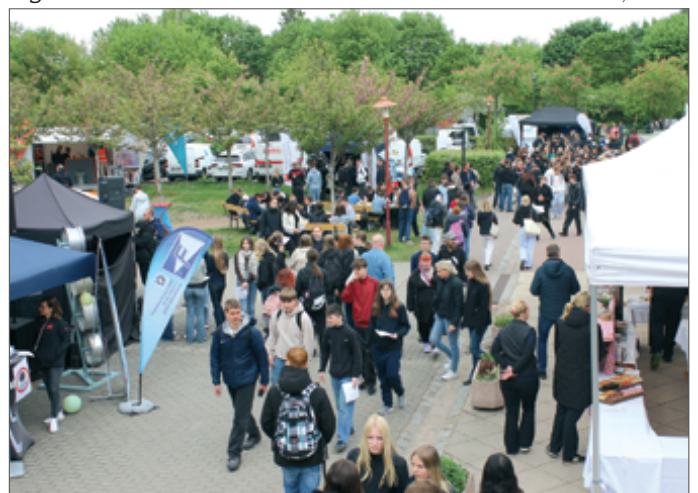
● Gut besucht war die „Career Compass“ an beiden Messetagen.