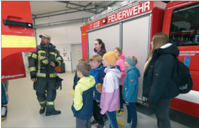
● Einblick in die ehrenamtliche Arbeit der Feuerwehr erhielten die Eggersdorfer Hortkinder