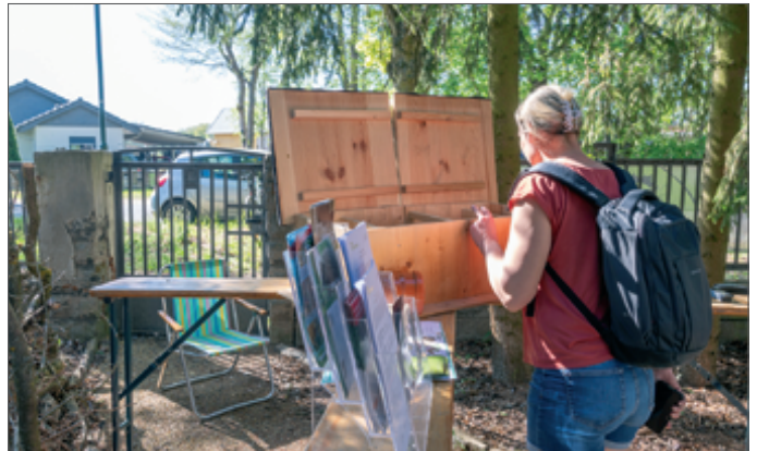
● Wie sieht eine Igelstutzhütte aus? An verschiedenen Stationen konnten die Besucher sich über die Arbeit des Vereins informieren.