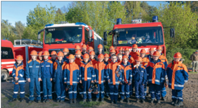
• Auch der Nachwuchs hatte eine wichtige Aufgabe bei der Unterstützung: Die Jugendfeuerwehr half bei der Brandwache und übernahm gemeinsam mit den Kameraden der Freiwilligen Feuerwehr das Ablöschen des Maifeuers.