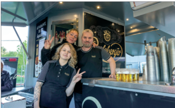
• Die Teams von „Madels“ (oben) und „Geflecktem Schwein“ umsorgten die Gäste.