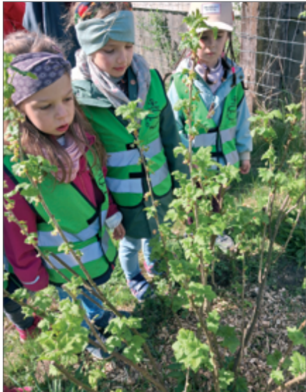
● Die Kinder begutachten den Johannisbeerstrauch, den sie im Herbst gemeinsam gepflanzt hatten. Er ist gut angewachsen.