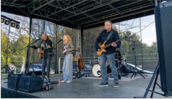
• Die Band „Radio on Fire“ sorgte am 30. April für Stimmung auf der Wiese im Gewerbegebiet.