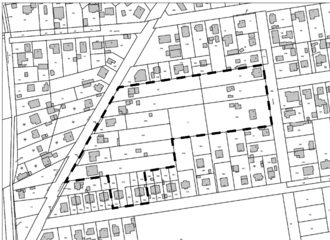
Geltungsbereich der 4. Änderung

Auf die Vorschriften des § 44 Abs. 3 Satz 1 und 2 BauGB über die Geltendmachung etwaiger Entschädigungsansprüche nach §§ 39 bis 42 BauGB und auf die Vorschrift des § 44 Abs. 4 BauGB über das Erlöschen der Entschädigungsansprüche bei nicht fristgerechter Geltendmachung wird hingewiesen.