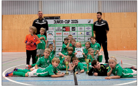
Hallenturnier des MTV 1860

Ein großes Dankeschön geht an alle Organisatoren, Trainer, Schiedsrichter, Spender und Sponsoren, die solche Turniere erst möglich machen. Ein besonderer Dank gilt außerdem