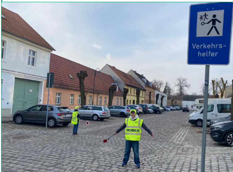
Die Schülerlotsen in der Klosterstraße

Die neue Regelung zur Schulwegsicherheit ist ein wichtiger Schritt in die richtige Richtung. Sie zeigt, dass sich gemeinsames Handeln lohnt und dass die Sicherheit unserer Kinder dort beginnt, wo Aufmerksamkeit, Rücksichtnahme und Verantwortung zusammenkommen.