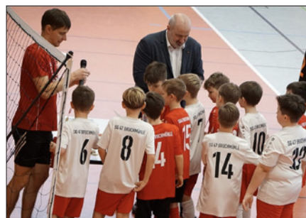
Siegerehrung der Hallenturnierserie der SG 47 Bruchmühle

Die gelungene Organisation und Durchführung der Turniere bewies einmal mehr, wie fähig und engagiert der Verein Veranstaltungen planen und umsetzen kann. Alle Beteiligten – von den Spielern über die Trainer bis hin