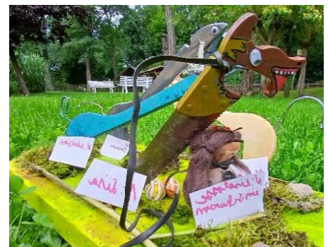
Kunstwerk aus Recyclingmaterialien

Aus Recyclingmaterialien entstanden mit Frau Winzer kreative Kunstwerke, die die Fantasie der Kinder zum Ausdruck brachten.