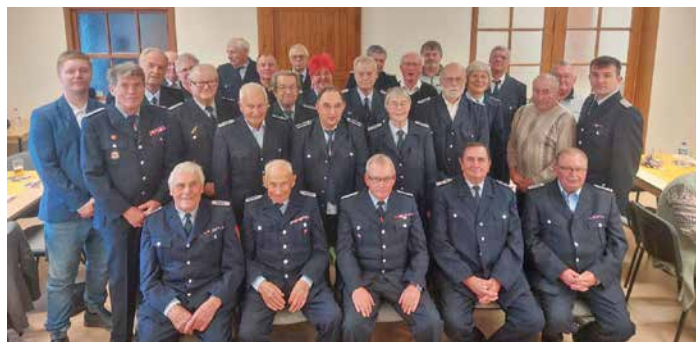
Bildrecht Gemeinde Letschin Christian Küttner

Beim anschließenden gemütlichen Beisammensein nutzten viele Gäste die Gelegenheit, Erinnerungen auszutauschen und alte Geschichten aufleben zu lassen. Bei dieser feierlichen Stunde würdigte die Freiwillige Feuerwehr der Gemeinde Letschin nicht nur das Engagement ihrer älteren Mitglieder, sondern zeigte auch, wie wichtig Zusammenhalt und Tradition im Feuerwehrwesen sind.